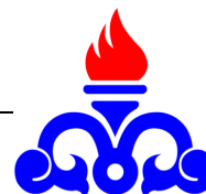
فهرست درآمدهای نفتی ایران طی سال‌های ۱۳۶۰-۱۳۸۸